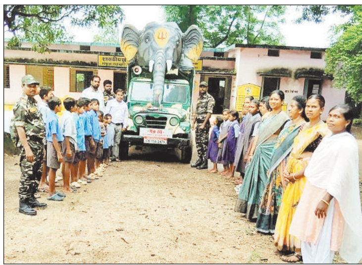
हाथी से बचाव के लिए रवाना किया गया था गजरथ।