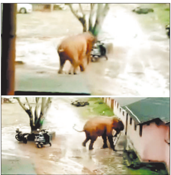
उत्पात मचाती हथिनी।