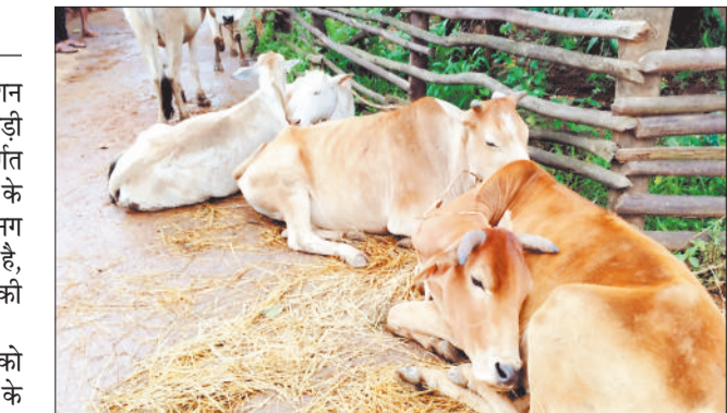
जब किए गए मवेशी।

■ झारखंड ले जाए जा रहे थे जंगल में गौ-वंश छोड़ आरोपी फरार